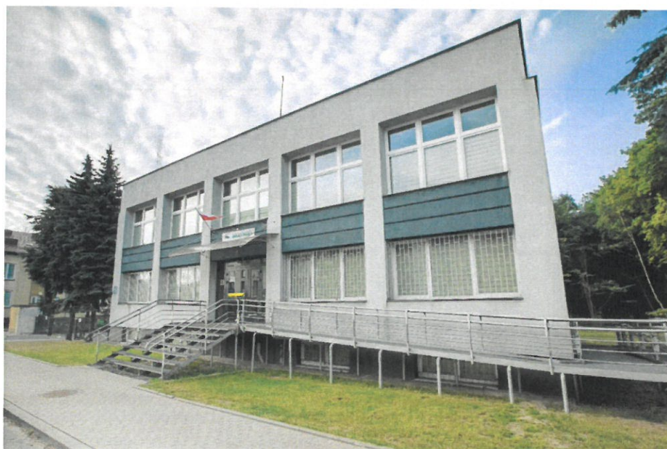
Powiatowy Urząd Pracy w Wyszkanie