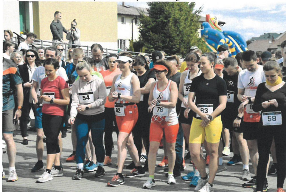
IX Bieg Konstytucji 3 Maja w Brańszczyku 2022 Patronat