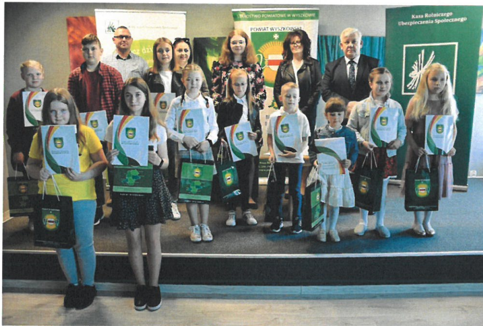
Konkurs plastyczny KRUS „Bezpiecznie na wsi mamy, bo ryzyko upadków znamy”