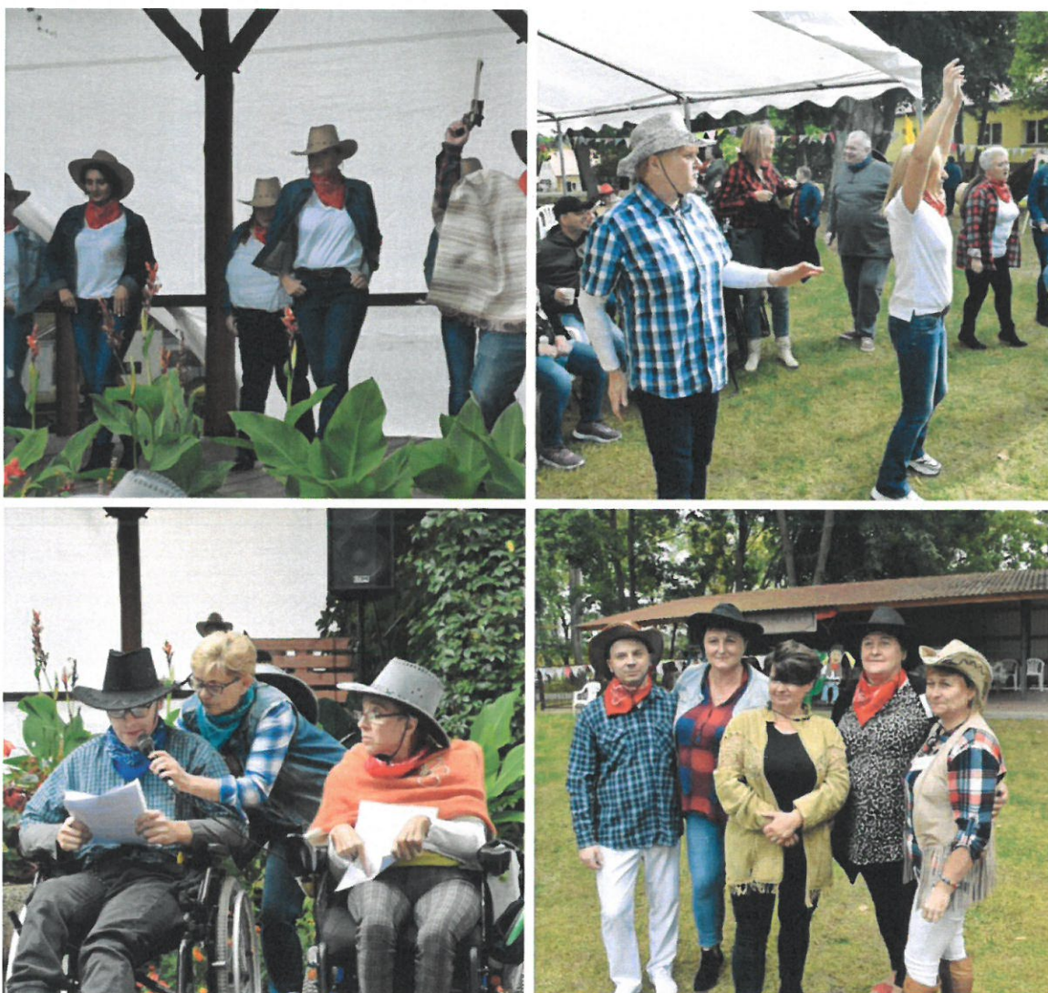
„Pożegnanie lata” w Domu Pomocy Społecznej w Brańszczyku

Domy pomocy społecznej świadczą usługi bytowe i opiekuńcze, wspomagające i edukacyjne na poziomie obowiązującego standardu, w zakresie i formach wynikających z indywidualnych potrzeb osób w nich przebywających.