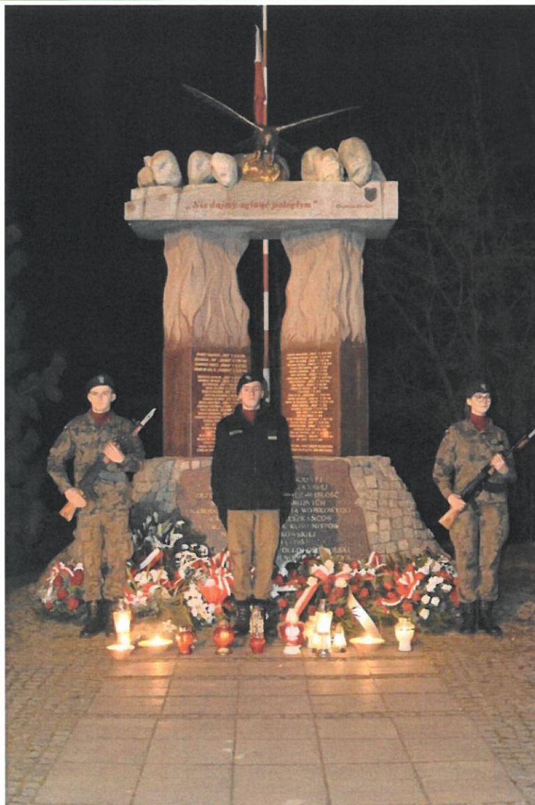
Narodowy Dzień Pamięci Żołnierzy Wyklętych