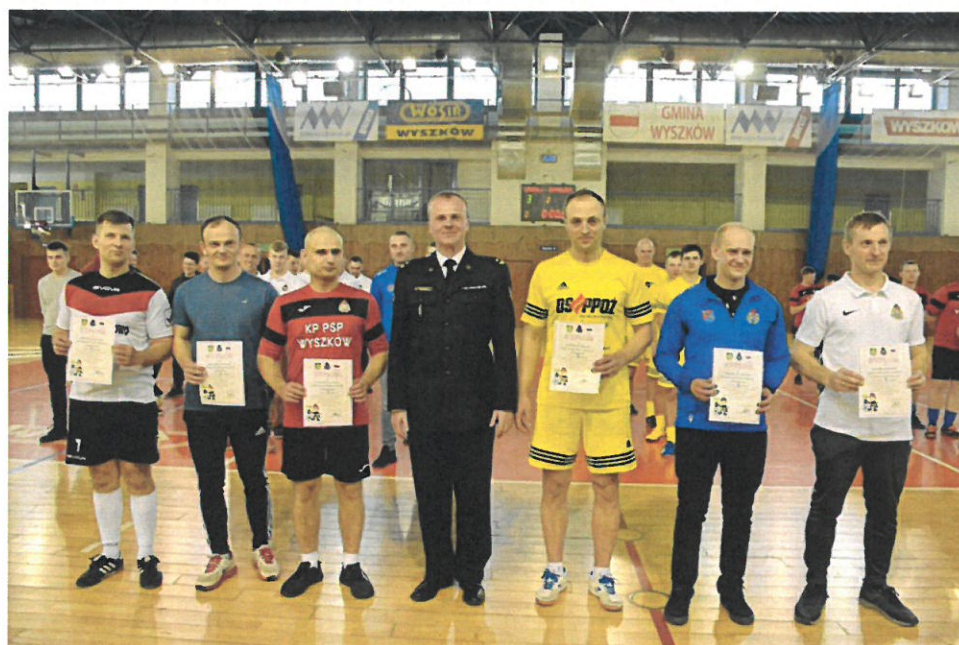
Eliminacje Strefowe do XIX Mistrzostw Województwa Mazowieckiego w Halowej Piłce Nożnej Strażaków patronat