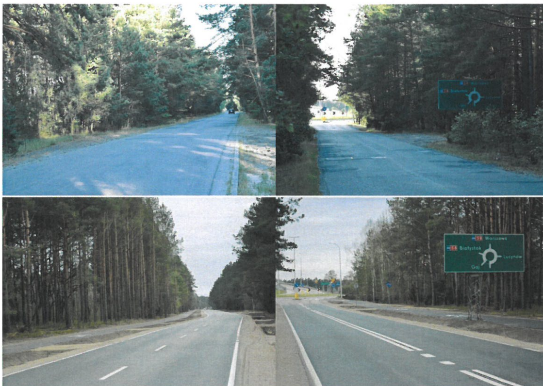
Budowa drogi powiatowej nr 4421W od węzła „Mostówka” na DK S-8 do działki ew. nr 10/1 położonej w m. Mostówka