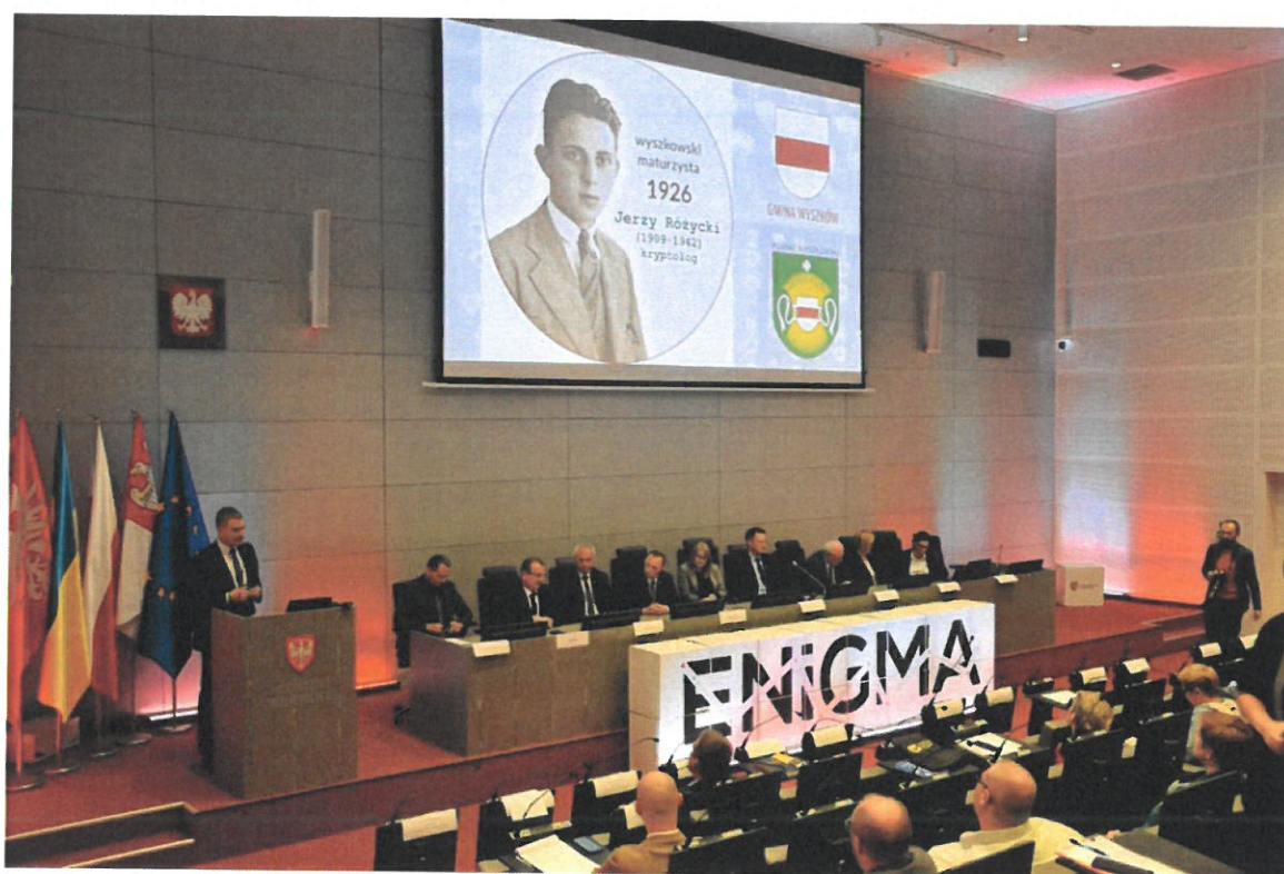
90. rocznica złamania szyfru Enigmy Centrum Szyfrów ENIGMA