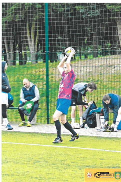
Powiatowa Liga Piłki Nożnej - 3 kolejka