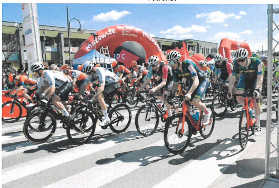
Wyścig Kolarski Grand Prix po Ziemi Wyszowskiej