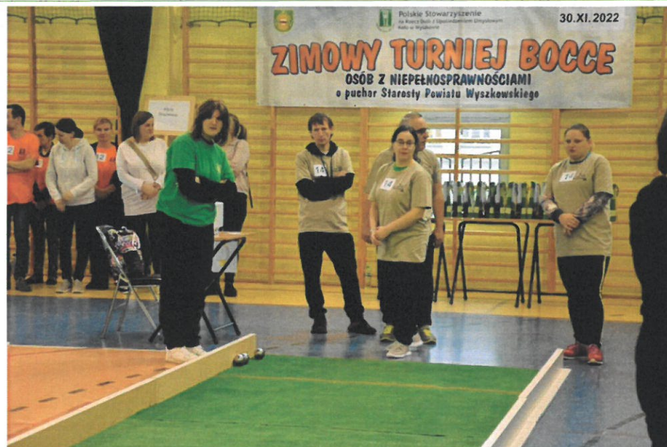
Turniej Bocce o Puchar Starosty Powiatu Wyszkowskiego patronat