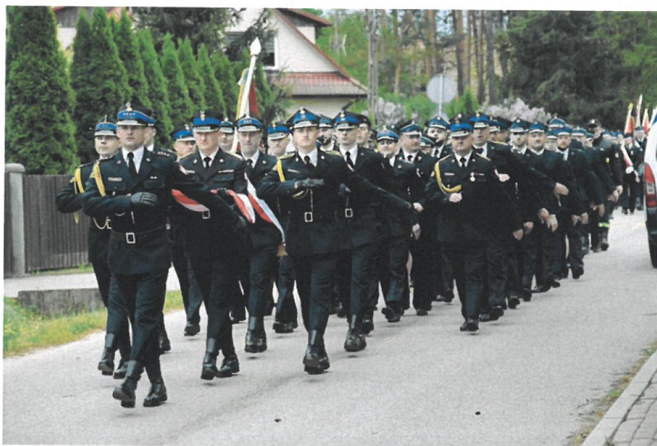
Powiatowy Dzień Strażaka 10-lecie OSP Gulczewo