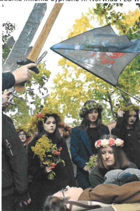
40-lecie nadania imienia Cypriana K. Norwida I LO w Wyszowie „Bema pamięci żałobny rapsod”