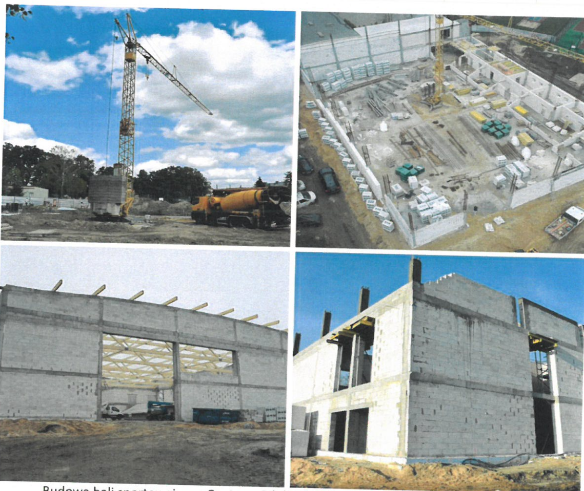
Budowa hali sportowej przy Centrum Edukacji Zawodowej i Ustawicznej „Kopernik” w Wyszkanie