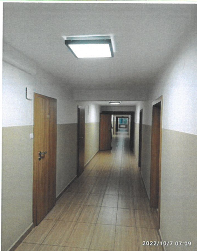
Internat I Liceum Ogólnokształcącego im. Cypriana Kamila Norwida w Wyszowie – korytarz na III piętrze budynku