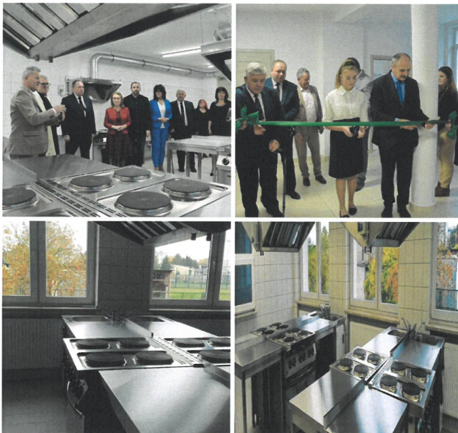
Adaptacja pomieszczeń kuchni, zaplecza i stołówki oraz podpiwniczenia na cele edukacyjne w Zespole Szkół nr 1 im. M. Skłodowskiej-Curie w Wyszkwie

Ogółem koszt przeprowadzonych remontów – 1.127.734 zł