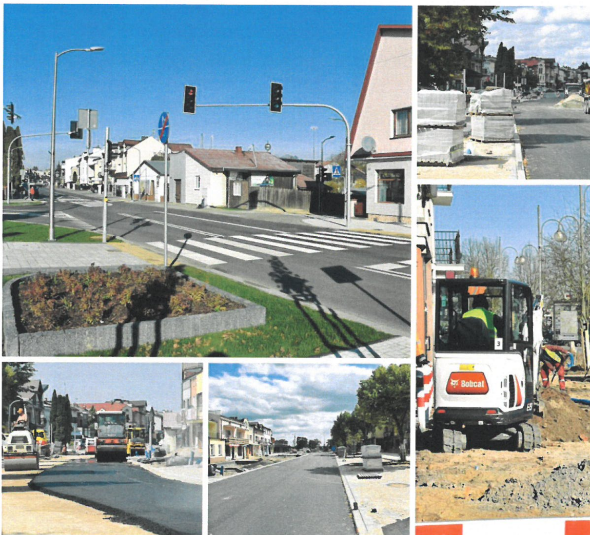
Budowa drogi powiatowej nr 4408W – ul. Daszyńskiego w Wyszki