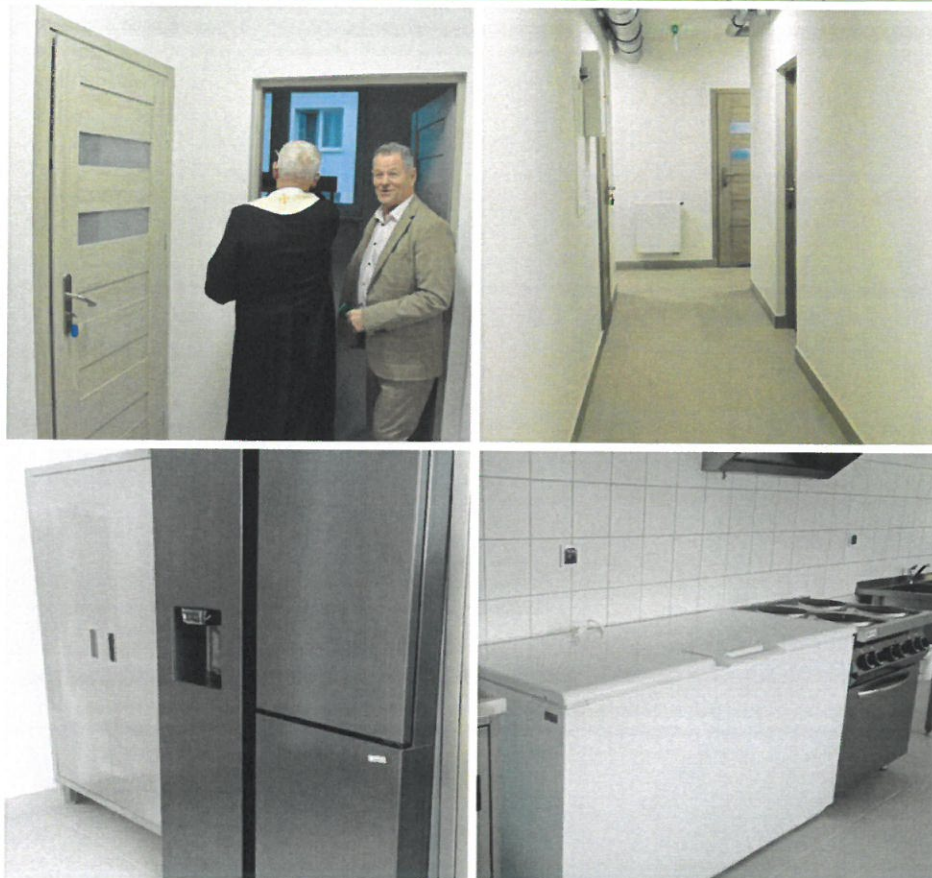
Adaptacja pomieszczeń kuchni, zaplecza i stołówki oraz podpiwniczenia na cele edukacyjne w Zespole Szkół nr 1 im. M. Skłodowskiej-Curie w Wyszowie