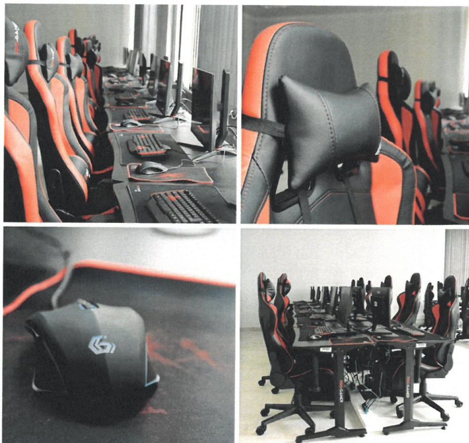
Nowo otwarta sala gamingowa w Centrum Edukacji Zawodowej i Ustawicznej „Kopernik” w Wyszkanie

Ogółem koszt przeprowadzonych remontów – 107.542 zł