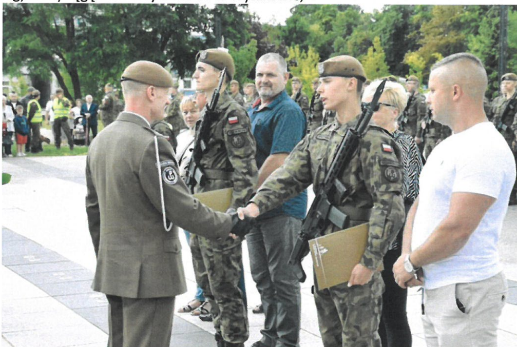
Przysięgę Żołnierzy 5 MBOT w Wyszowie