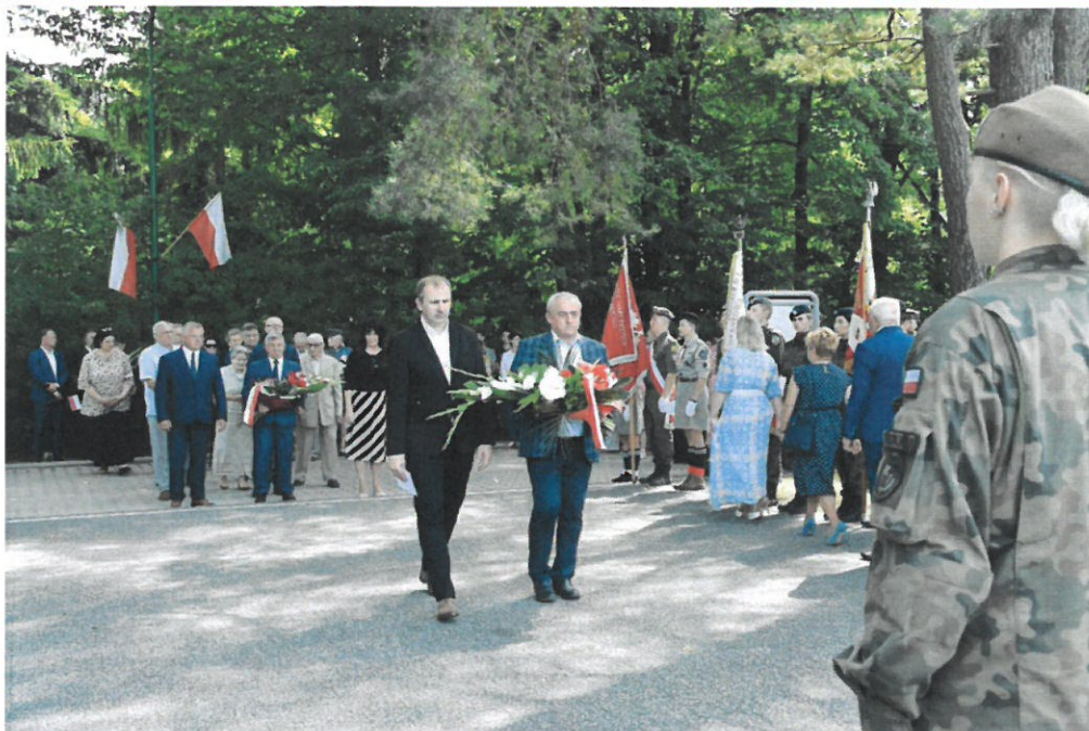
102. Rocznica Bitwy Warszawskiej - Święto Wojska Polskiego