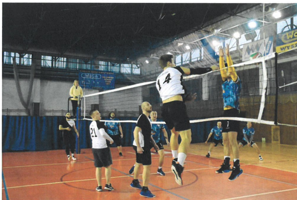
Powiatowa Liga Piłki Siatkowej