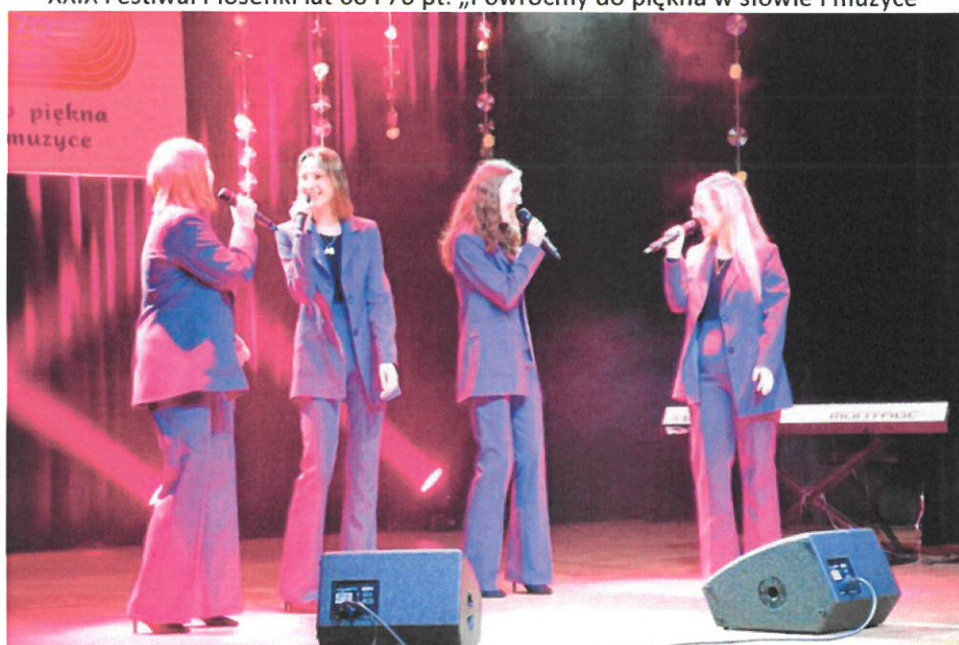
XXIX Festiwal Piosenki lat 60 i 70 pt. „Powróćmy do piękna w słowie i muzyce”