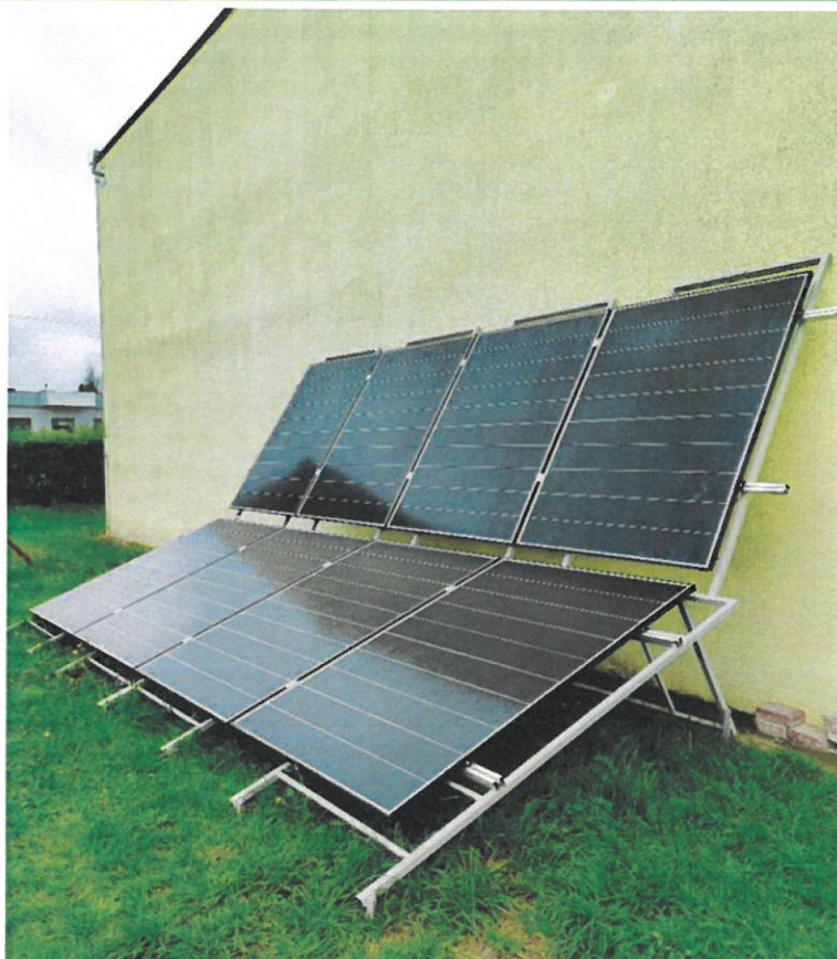
Panele fotowoltaiczne przy budynku Centrum Edukacji Zawodowej i Ustawicznej „Kopernik” w Wyszowie zamontowane w ramach realizowanego Projektu „Dobre kompetencje – lepszy start”