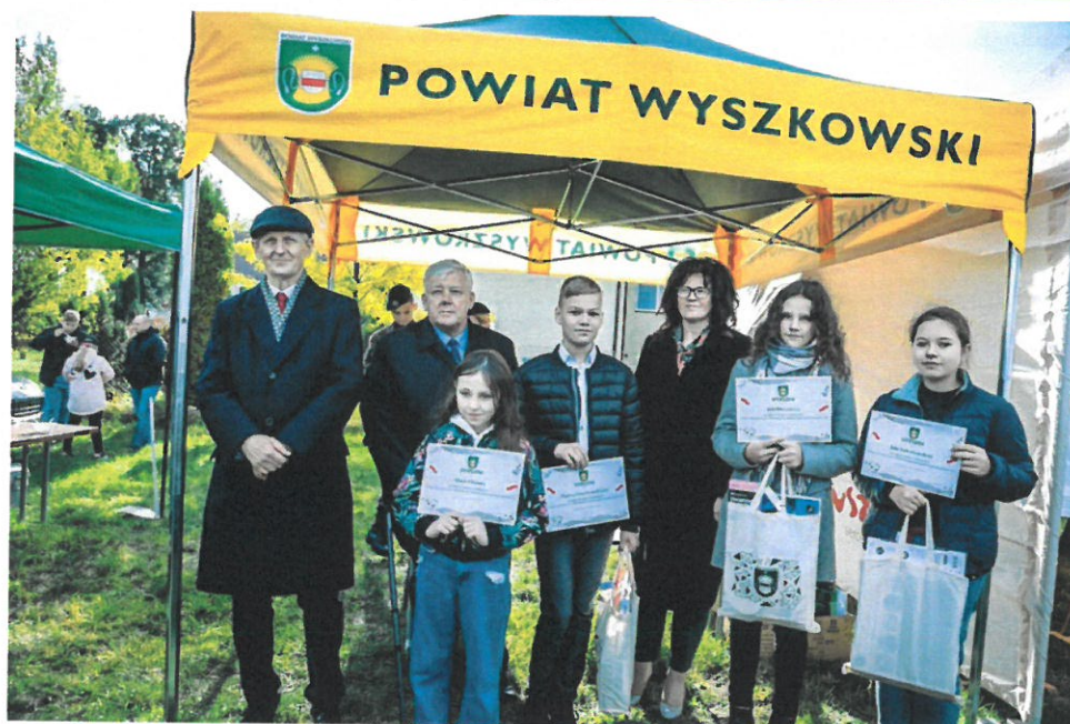
Rozstrzygnięcie konkursu plastycznego „Ilustracje do Polskich piosenek patriotycznych” podczas 83. rocznicy pobytu majora Henryka Dobrzańskiego „Hubala” w Porębie