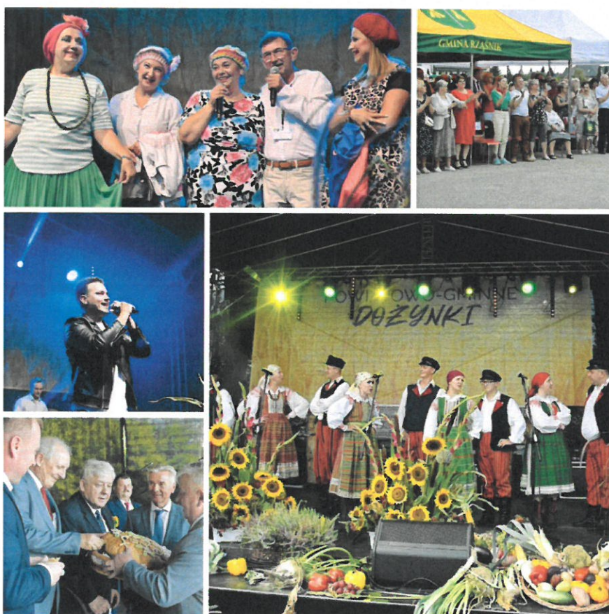
Dożynki Powiatowo-Gminne 2022 w Rzańniku