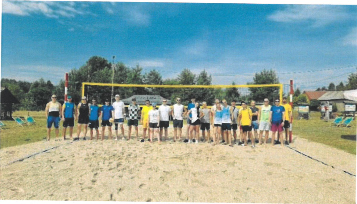
Zadanie pn. "Wakacyjny Turniej Siatkówki Plażowej 2022" realizowane przez Stowarzyszenie Bocian KRiS