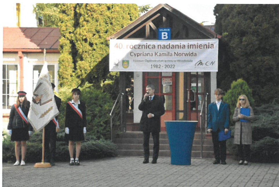
40-lecie nadania imienia Cypriana K. Norwida I LO w Wyszowie