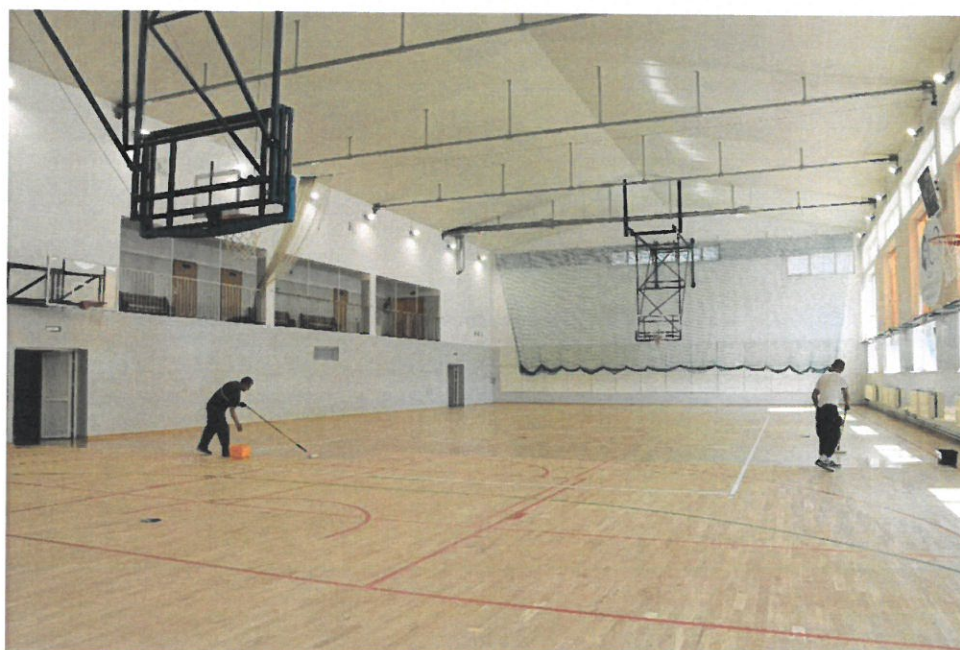
Remont sali gimnastycznej w I Liceum Ogólnokształcącym im. C. K. Norwida w Wyszowie