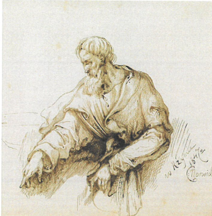
Ryc.2. "Brodaty mężczyzna w antykizowanej szacie, 1847" autorstwa Cypriana Norwida - pierwsze muzeum zakupione przez Muzeum Cypriana Norwida w Dębinkach.