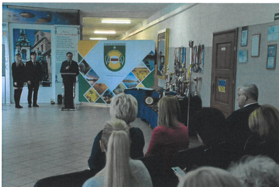
„Panteon sportu – najpiękniejsze chwile zapisane w pamięci polskich kibiców” – mobilna wystawa Ministerstwa Sportu i Turystyki w Centrum Edukacji Zawodowej i Ustawicznej „Kopernik” w Wyszkanie