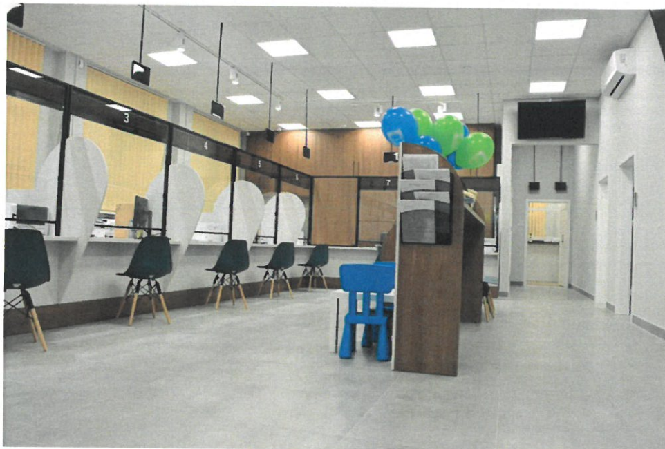
Wydział Komunikacji Starostwa Powiatowego w Wyszowie

W siedzibie starostwa przy ulicy Świętojańskiej 82c zlokalizowany jest Wydział Komunikacji. Wydział zajmuje obecnie ponad 315 metrów kwadratowych powierzchni, posiada przestronną salę obsługi, duży parking, system kolejkowy, możliwość internetowej rezerwacji wizyt a także możliwość bezdotykowego potwierdzenia rezerwacji internetowej lub pobrania numerka za pomocą aplikacji QMS. Everywhere. Obsługa interesantów odbywa się w klimatyzowanych pomieszczeniach.