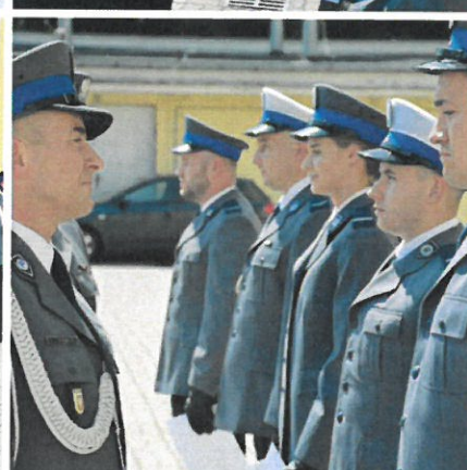
Święto Policji 2022