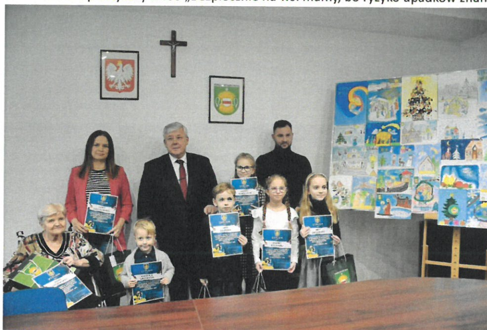
Konkurs plastyczny „Zaprojektuj oficjalną kartkę Bożonarodzeniową Powiatu Wyszkowskiego”