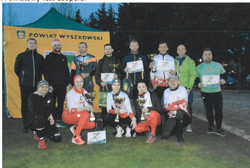
I Powiatowy Test Coopera