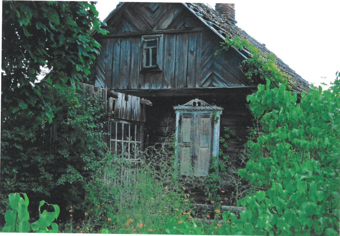
Architektura kurpiowska. Zadanie publiczne pn. Architektura Kurpi Białych – stan zachowania na 2022 r." realizowane przez Stowarzyszenie "Wspólna Przyszłość".

Na realizację powyższych zadań zarówno w trybie konkursowym jak też w trybie pozakonkursowym 21 organizacji pozarządowych podpisało w powiecie wyszkowskim 32 umowy.