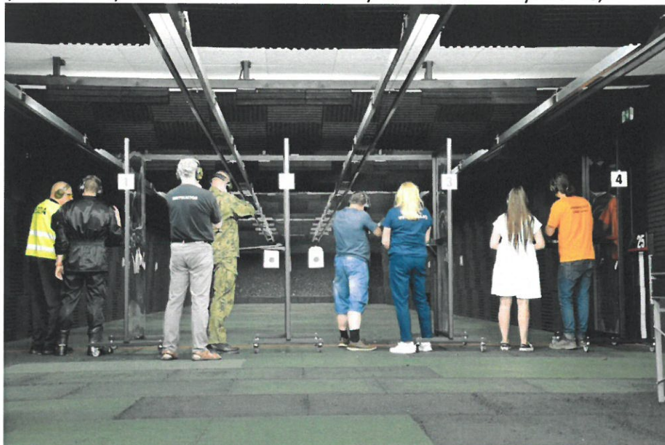
XI Zawody Strzeleckie o Puchar Starosty i Szefa WCR w Wyszowie