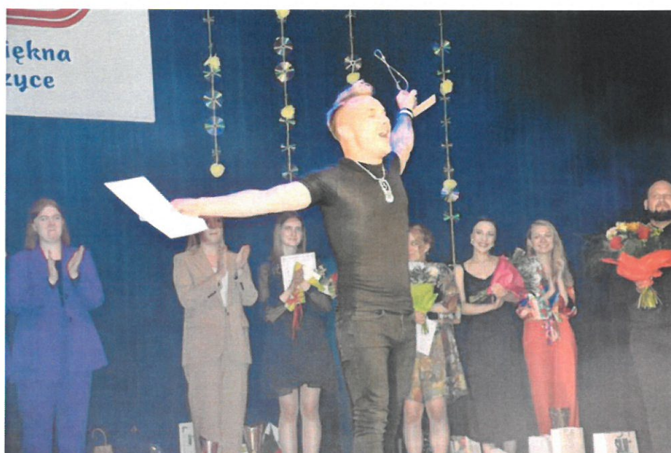
XXIX Festiwal Piosenki lat 60 i 70 pt. „Powróćmy do piękna w słowie i muzyce”