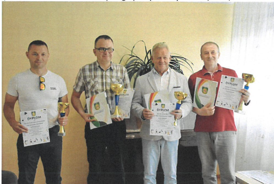
Podsumowanie Powiatowych Igrzysk Sportowych 2021/2022