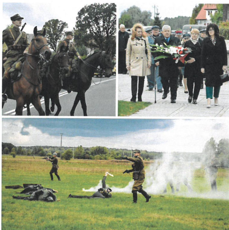
Obchody 83. Roczniczy pobytu majora Henryka Dobrzańskiego „Hubala” w Porębie