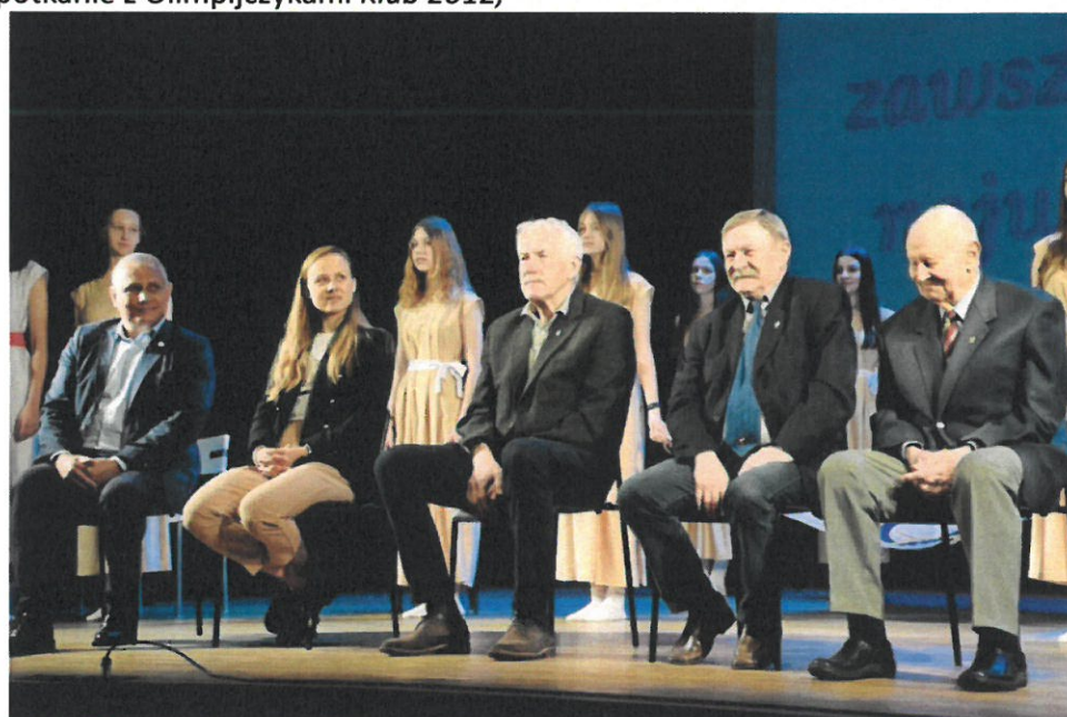
Spotkanie z Olimpijczykami Klub 2012