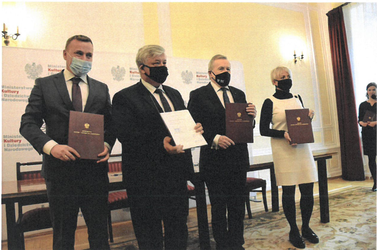
Ryc.1 Podpisanie umowy o współprowadzeniu Muzeum Cypriana Norwida w Dębinkach (w organizacji) z Ministrem Kultury i Dziedzictwa Narodowego, Warszawa, 1 lutego 2022 r.

W roku 2022 r. dzięki dotacji przyznanej z budżetu państwa Muzeum zakupiło pierwsze muzealium - rysunek autorstwa Cypriana Norwida „Brodaty mężczyzna w antykizowanej szacie, 1847”. Rysunek sygnowany monogramem wiązany, datowany i opisany w Rzymie | 1847 | CNorwid' (ryc. 2). W roku 2022 Muzeum Cypriana Norwida w Dębinkach (w organizacji) realizowało swoje cele i zadania statutowe m.in. poprzez upowszechnianie wiedzy o Cyprianie Norwidzie i jego twórczości, prowadzenie działalności edukacyjnej, prowadzenie działalności artystycznej i upowszechniającej kulturę, prowadzenie działalności wydawniczej czy współpracę z polskimi i zagranicznymi muzeami, administracją rządową i samorządową, instytucjami kultury i mieszkańcami.