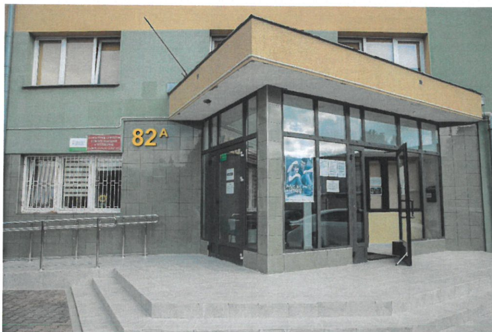
Powiatowe Centrum Pomocy Rodzinie w Wyszkanie