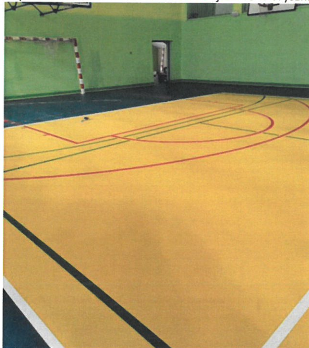
Sala gimnastyczna w Zespole Szkół nr 1 im. M. Skłodowskiej-Curie w Wyszowie