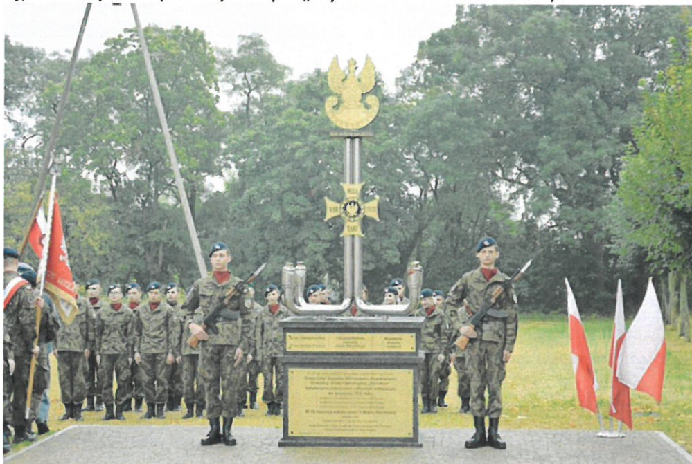
Uroczystości patriotyczne pn. „Wyszowski Wrzesień 1939”