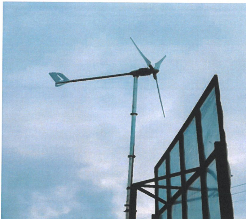
Elektrownia wiatrowa przy Centrum Edukacji Zawodowej i Ustawicznej „Kopernik” w Wyszkowie, w ramach realizowanego Projektu „Dobre kompetencje – lepszy start”