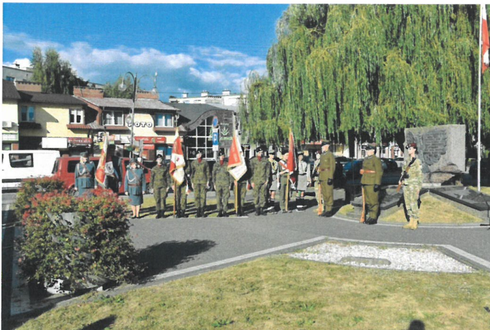
83. rocznica wybuchu II Wojny Światowej