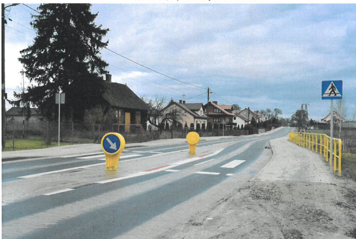
Budowa drogi powiatowej nr 4408W w miejscowości Porządzie