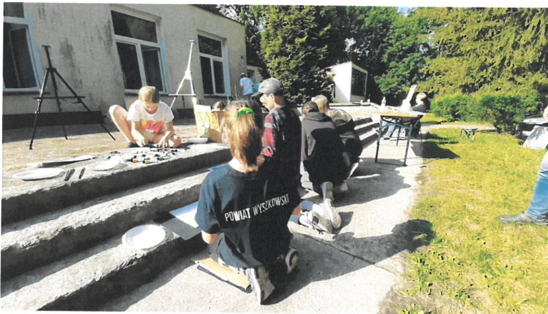
Plener malarski pn. "Lirycznie, romantycznie". Zadanie publiczne realizowane przez Stowarzyszenie Form Artystycznych i Turystycznych "FormAT".