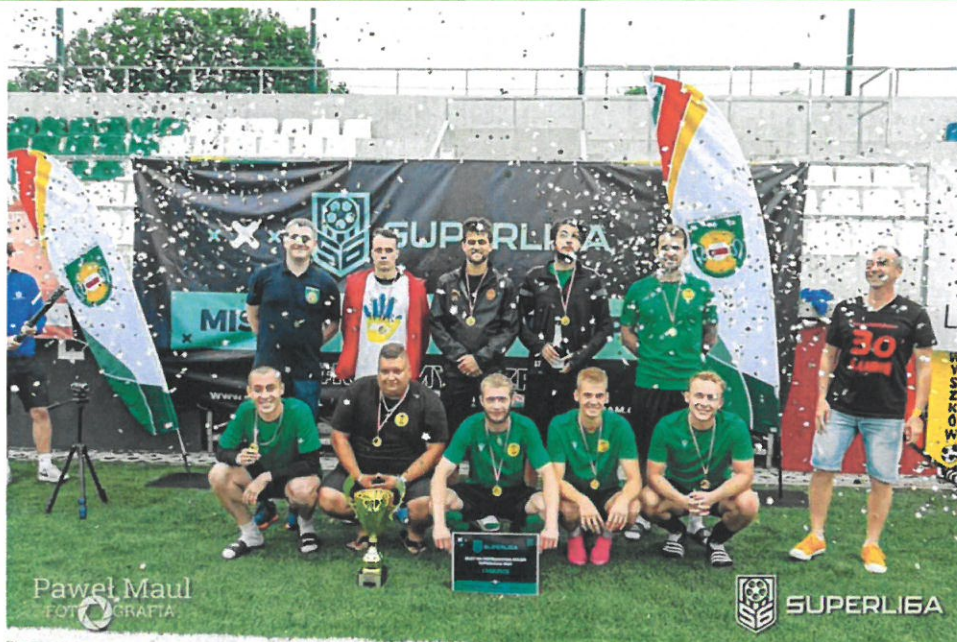
SL6 Cup 2022 – Turniej Eliminacyjny Do Mistrzostw Polski SuperLiga6 l) SL6 Cup 2022 – Turniej Eliminacyjny Do Mistrzostw Polski SuperLiga6, m) Spotkanie z Olimpijczykami Klub 2012,