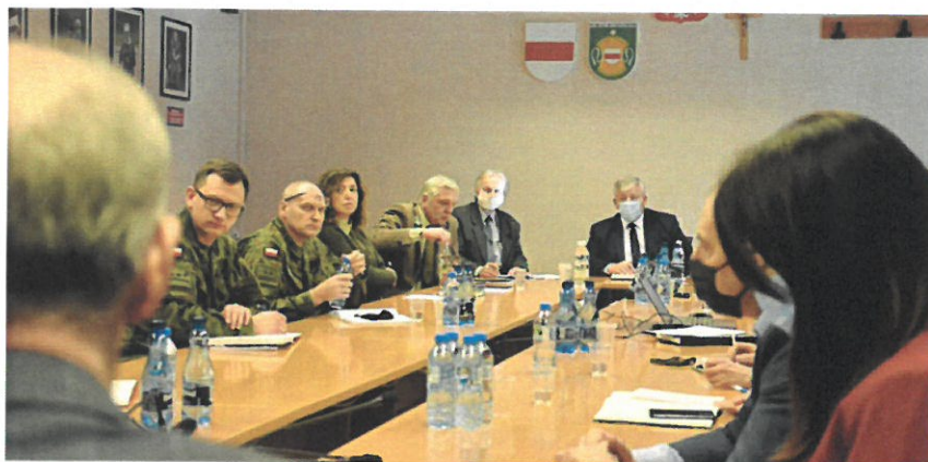
Posiedzenia Komisji Porządku i Bezpieczeństwa