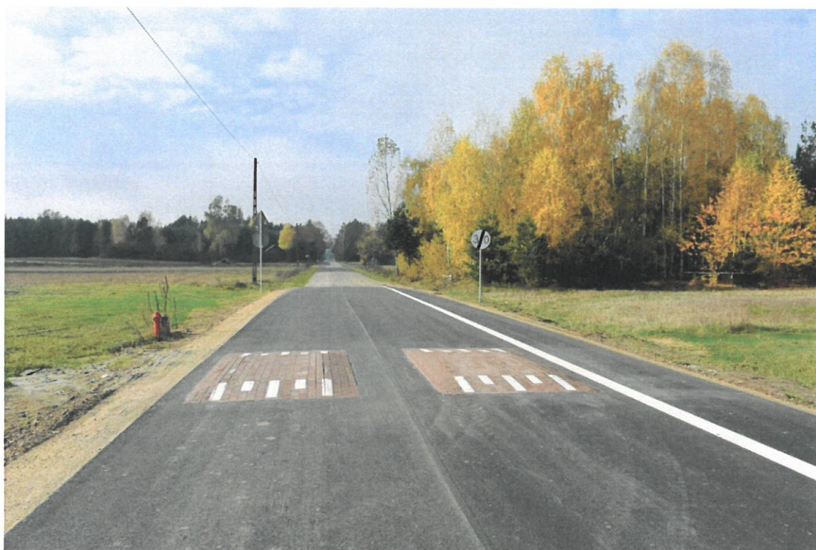
Przebudowa drogi powiatowej nr 4402W na odcinku Nowa Pecyna – Długosiodło