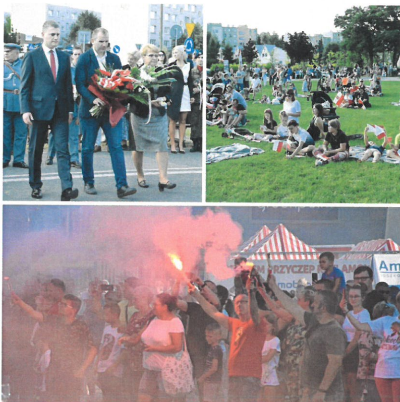
Obchody 78. rocznicy wybuchu Powstania Warszawskiego